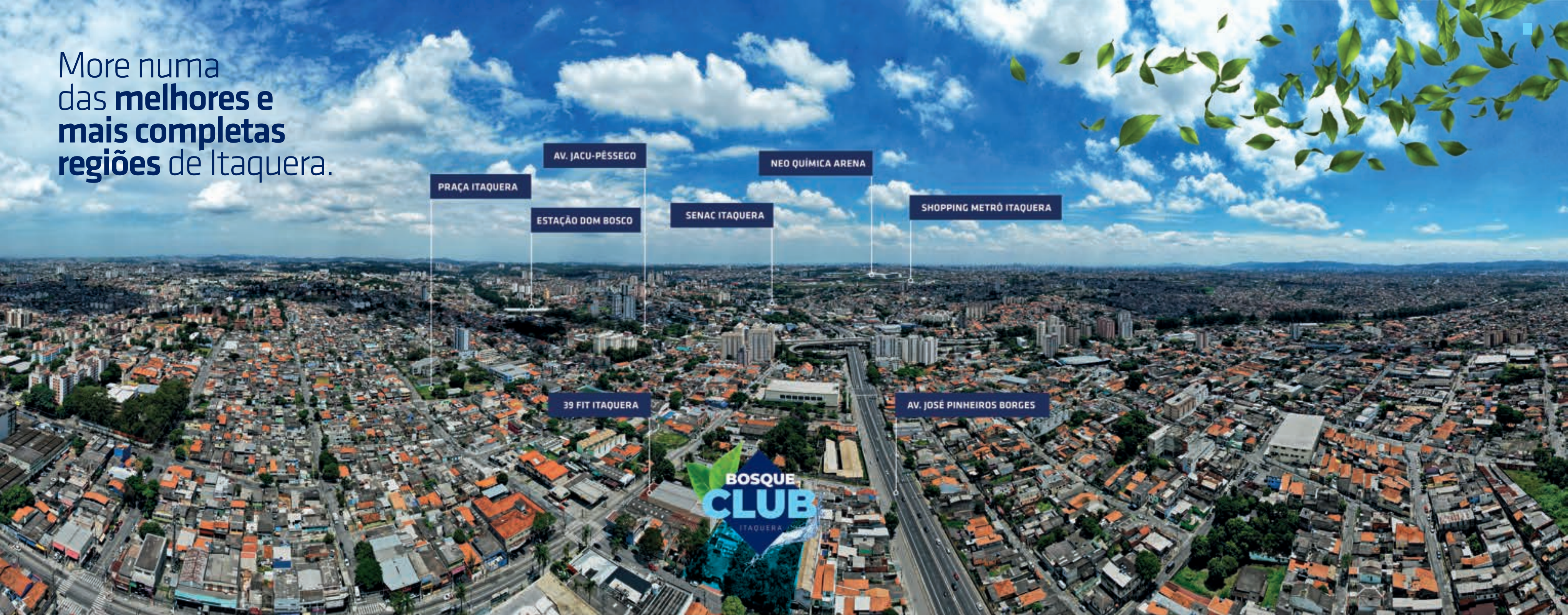
Foto aérea do local.

More numa das melhores e mais completas regiões de Itaquerana.