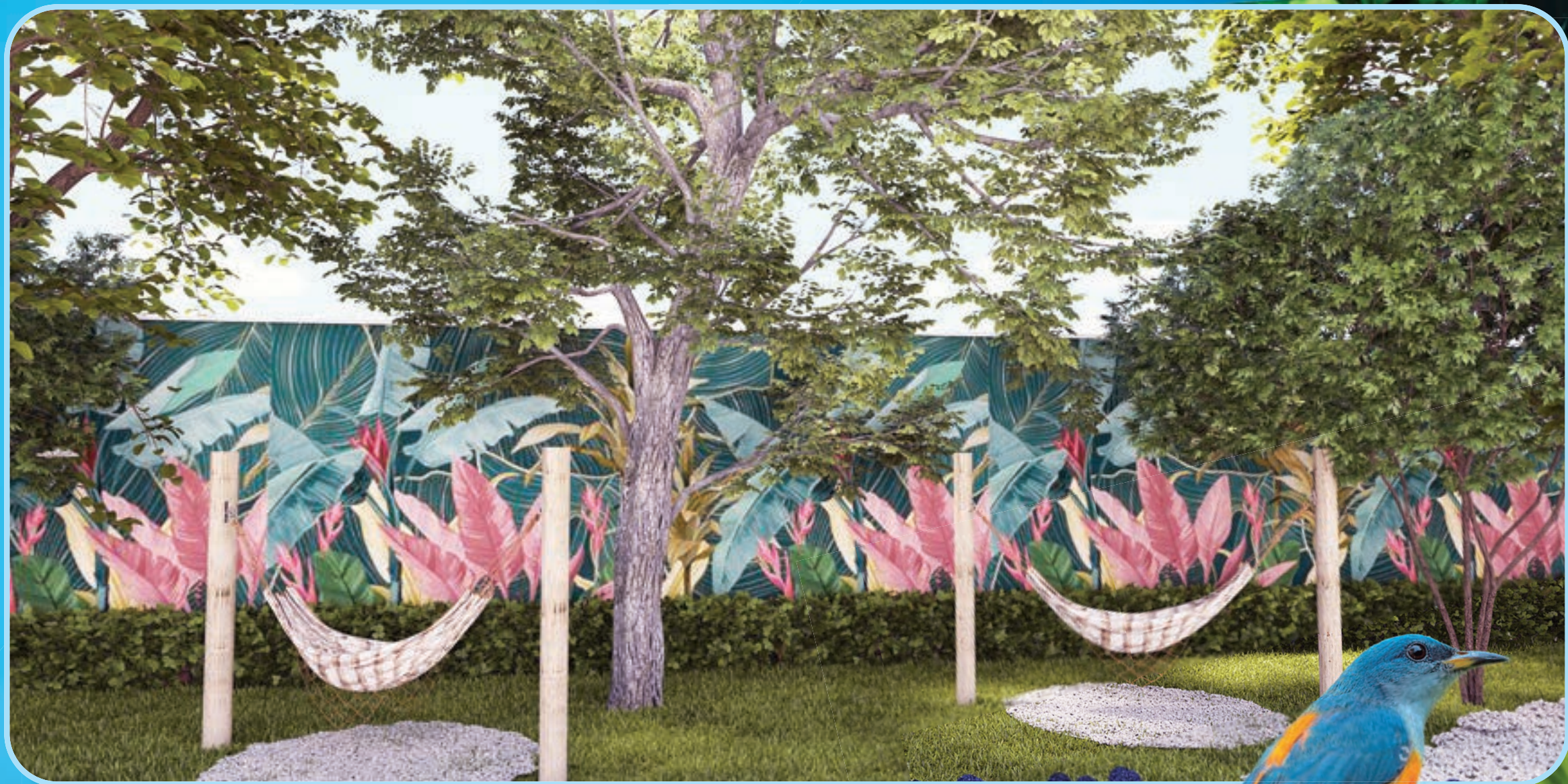
Perspectiva ilustrada do redário . *Vide texto legal.