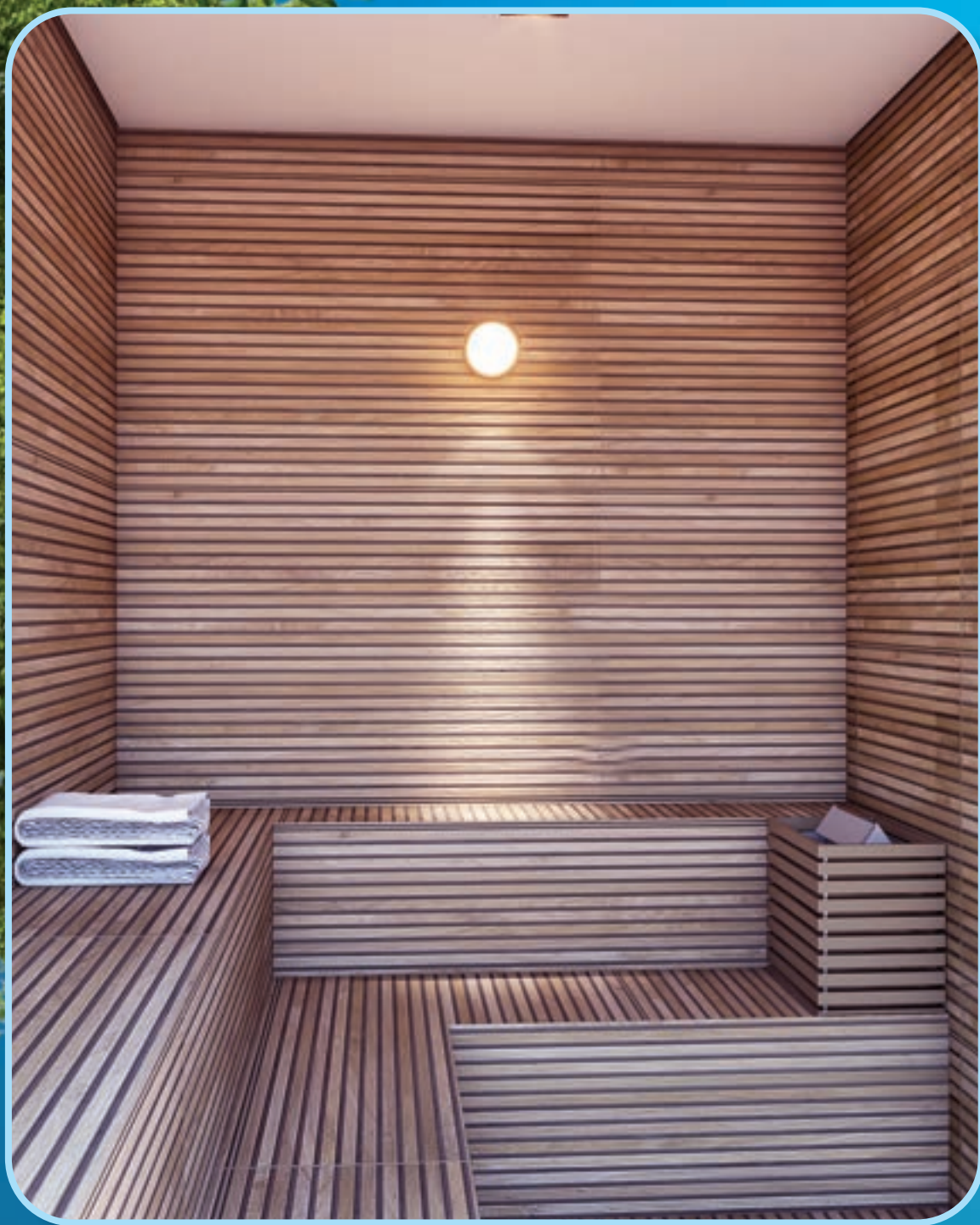
Perspectiva ilustrada do sauna . *Vide texto legal.