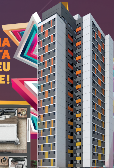
IMAGEM PIRELLA GÖTTSCHE LOWE

SUA PRÓXIMA CONQUISTA ESTÁ AO SEU ALCANCE!